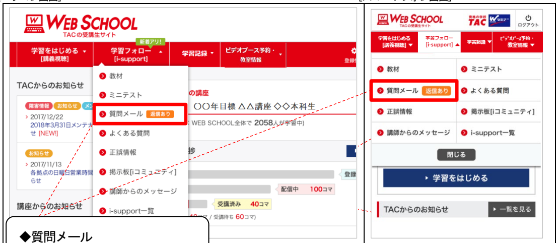
[スマートフォン画面]