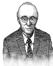
(Jerome Seymour Bruner・1915～2016)