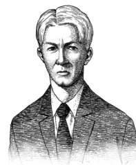
(William Heard Kilpatrick・1871~1965) アメリカの教育学者