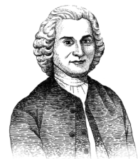
(Jean-Jacques Rousseau・1712～1778) フランスの哲学者