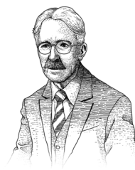
（John Dewey ・ 1859 ～ 1952） プラグマティズムの代表的哲学者