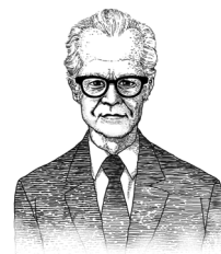
(Burrhus Frederic Skinner・1904～1990)