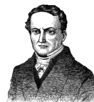
(Johann Friedrich Herbart・1776～1841)