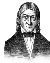
(Friedrich Wilhelm August Fröbel・1782～1852) ドイツのテューリンゲン州生まれ